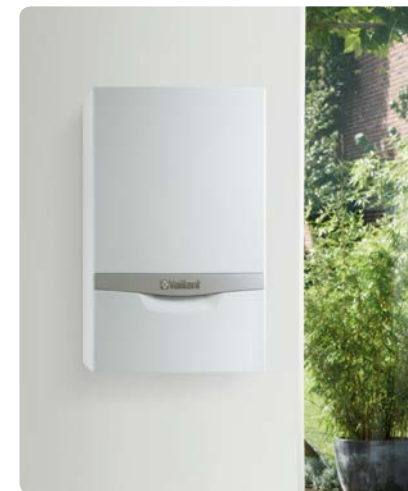
Gas-Brennwertgerät ecoTEC plus: der ideale Ersatz für die meisten Heizwertgeräte

Fachmännische Beratung hilft Ihnen weiter. Ihr Heizungsinstallateur ist der richtige Ansprechpartner rund um das Thema Heiztechnik. Er kennt die Vorzüge der verschiedenen Geräte im Detail, kann die Gegebenheiten bei Ihnen vor Ort prüfen und Ihnen so die beste Lösung für Ihren Wärme- und Warmwasserkomfort empfehlen.