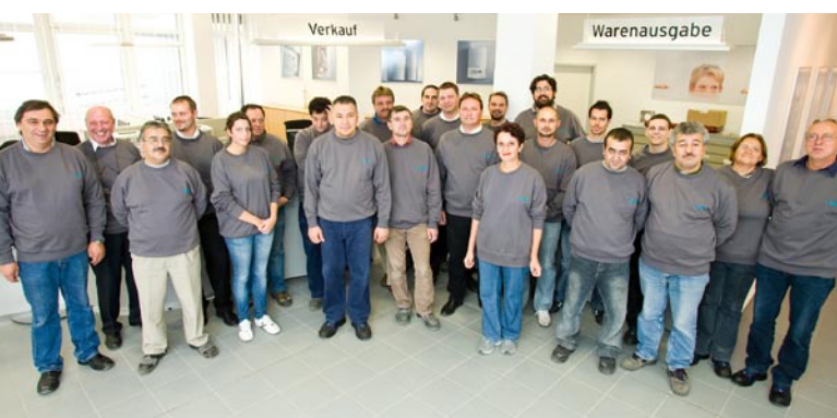
Das Vaillant-Team des neuen Fachpartner-Logistikzentrums