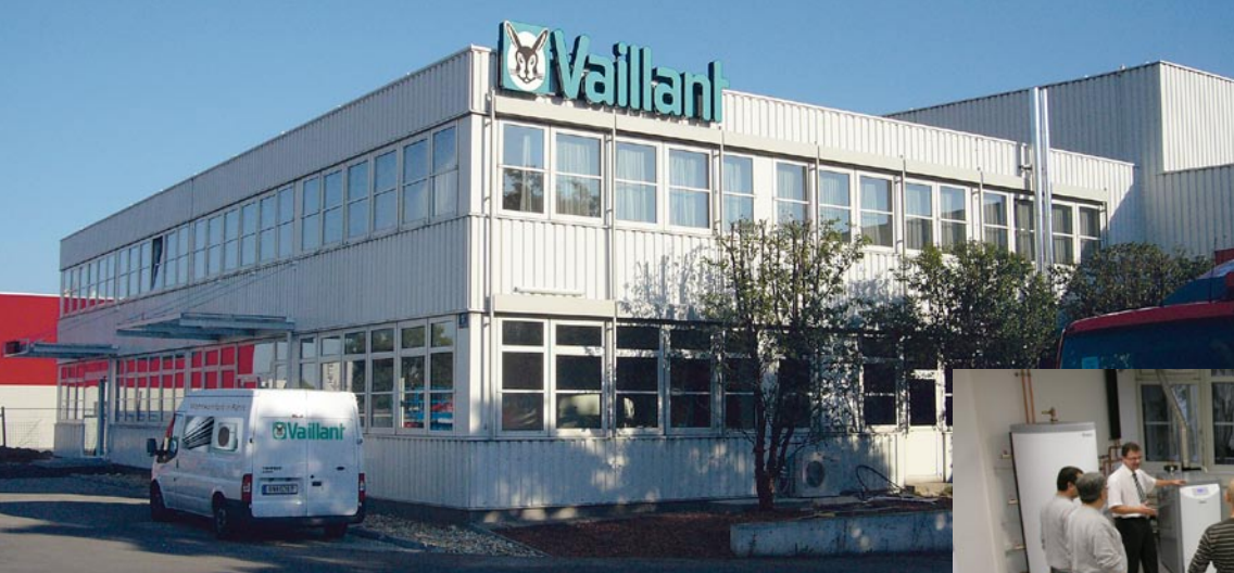
Das neue Fachpartner-Logistikzentrum in der Wiener Jochen-Rindt-Straße 5