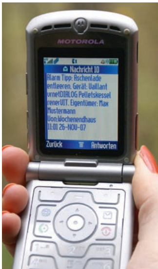
vernet-DIALOG meldet jeden Störfall automatisch per SMS.

Die Familie Fuchs entschied sich vor allem aus ökologischen Gründen für die umweltfreundliche und energieeffiziente Vail-