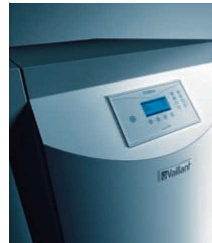
Die Inbetriebnahme des renerVIT ist im Preis inkludiert.

Stunden (in der Zeit vom 7.30 – 20.00 Uhr) beim Kunden an. Spätestens 24 Stunden nach dem Anruf steht der Kundendienst vor der Tür. Sollte der Kundendienst diese zeitliche Vorgabe nicht einhalten, verlängert sich die dreijährige Wärmegarantie, die für alle Vaillant renerVIT-Heizkessel gilt, auf vier Jahre. Einzige Ausnahme: Der Kunde hat die Verspätung – weil er zum Beispiel nach der Verständigung nicht zu Hause angetroffen wird – selbst zu verantworten.